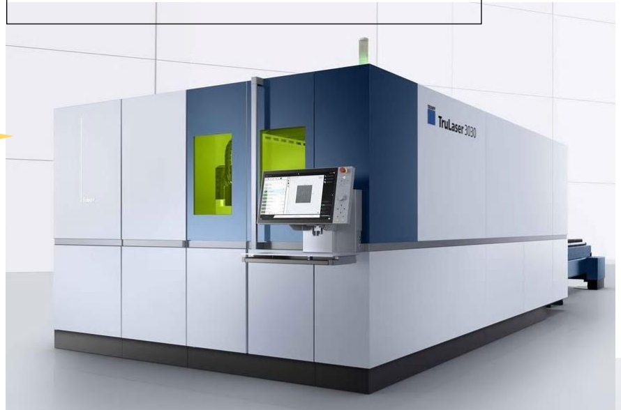
TruLaser 3030 fiber 6 KW