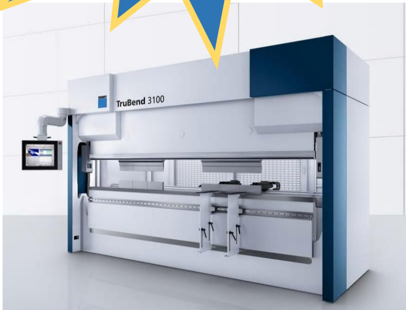
TruBend 3000 / 4m / 230t